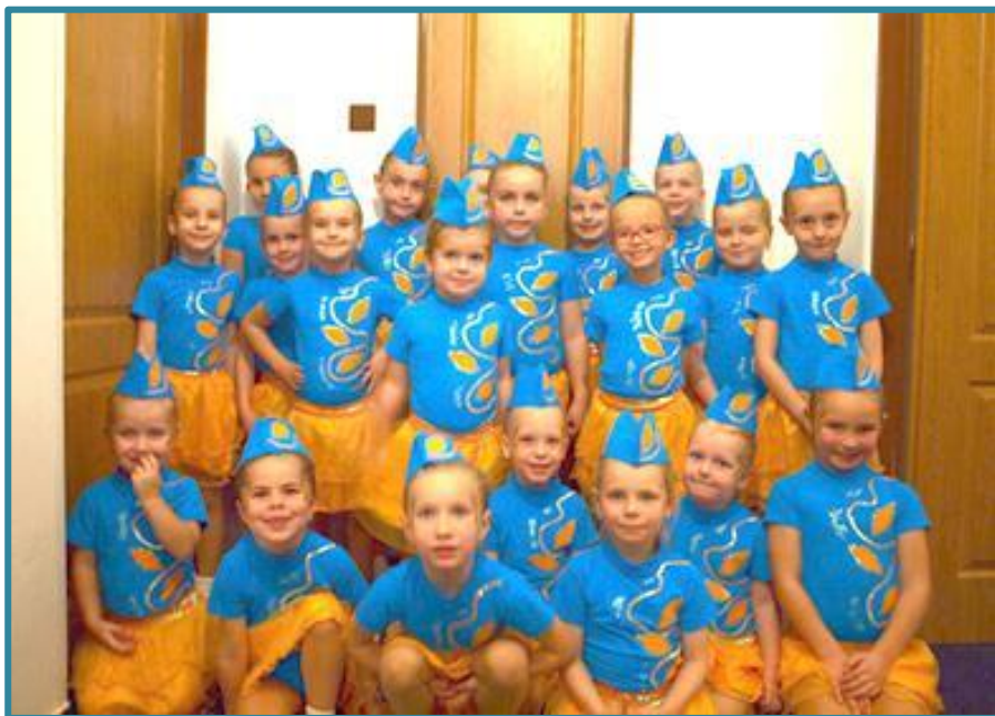
Babymažoretky a Školička